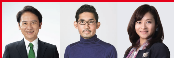
北九州市長 武内 和久